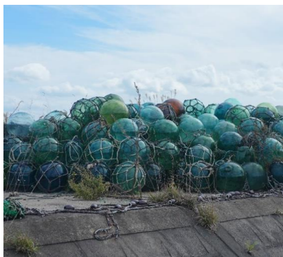
漁港に積み上げられた浮玉