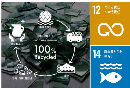
「DOUBLE F -UKIDAMA EDITION-」ができるまで