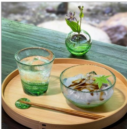
色を揃えると統一感が生まれます

箸置、グラス、小鉢、一輪挿しを各6色、合計24アイテムでラインナップ。グラスは普段使いに適したサイズで、色ガラスの陰影が食卓に特別な雰囲気を与えます。小鉢は冷たい甘味やサラダなどにも対応し、料理を美しく引き立てます。箸置は色違いを組み合わせることでテーブルを華やかに演出。一輪挿しは手のひらサイズで食卓や小スペースにも飾りやすく、ころんとした丸みのある形状はオブジェとしての魅力も持ち合わせています。グラス・小鉢・一輪挿しは化粧箱入り、箸置は台紙付きのフィルム包装で、各色の物語が伝わる仕様となっており、贈り物にも最適です。