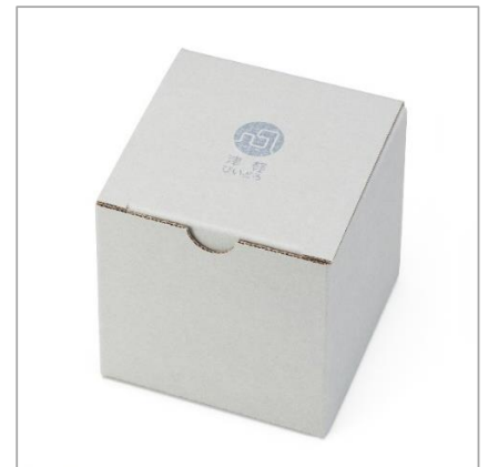
商品の色彩が映えるグレーの化粧箱